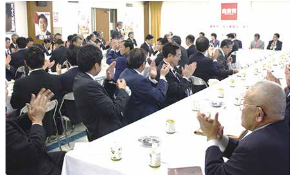
自民党たばこ議員連盟の総会

全国たばこ販売政治連盟では、国会議員・地方議員の理解と協力を得ながら、たばこ業界の健全な発展に向けての活動を展開しています。国レベルでは、衆参国会議員の多数が参加する、自民党たばこ議員連盟及びたばこ特別委員会と協働してたばこ税増税反対や「分煙社会の実現」などの重要課題の解決に取り組んでいます。