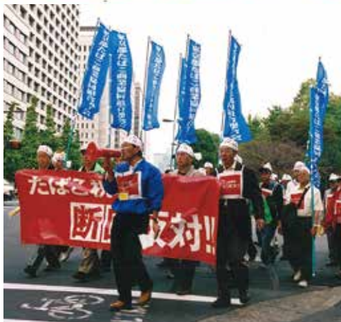
「たばこ税増税反対総決起大会」と実行運動