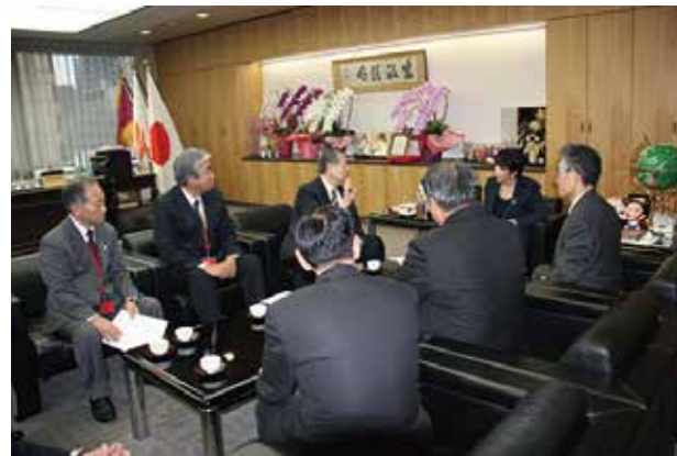
関係省庁への陳情活動